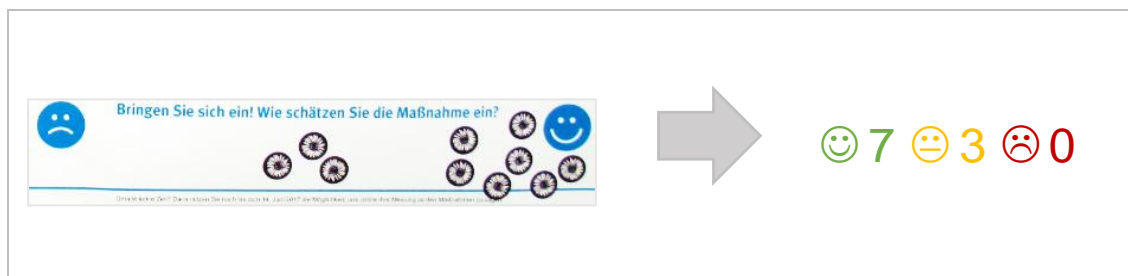
Abbildung 2 Beispielhafte Darstellung eines Bewertungsfeldes und Auswertung der Bewertung (Vorschlag Maßnahme W-05)

Die Bewertung der Maßnahmen konnten die Bürgerinnen und Bürger vornehmen, indem sie vorbereitete Aufkleber in ein Bewertungsfeld klebten. Zur vereinfachten Darstellung in der Dokumentation und um eine Vergleichbarkeit mit den Bewertungen im Online-Dialog zu gewährleisten, wurden die Bewertungen im Rahmen der Auswertung in eine dreistufige Skala überführt (siehe Abbildung 2). Damit konnten die Bürgerinnen und Bürger symbolisieren, ob Ihnen die Maßnahme sehr wichtig , weniger wichtig oder nicht wichtig erscheint.