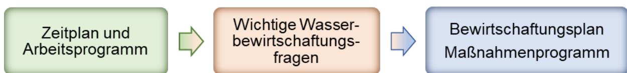
Abbildung 1: Anhörungsphasen

Die Information, Anhörung und Beteiligung der Öffentlichkeit ist ein verbindlicher Bestandteil der WRRL. Wie im ersten und zweiten Bewirtschaftungszyklus ist auch für den dritten Bewirtschaftungszeitraum ein dreistufiges Anhörungsverfahren vorgesehen, an dem Sie sich aktiv beteiligen können.