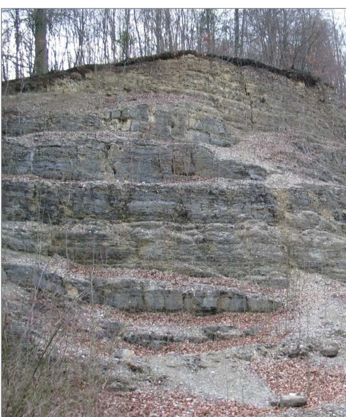
Humusbildung und -anreicherung